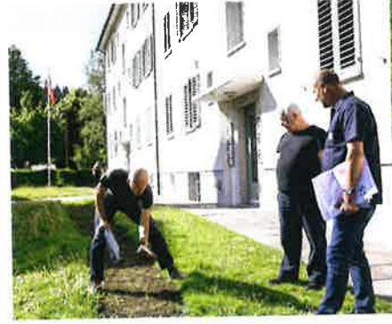
Einen guten Monat nach der Aussaat sehen die künftigen Blumenstreifen noch dürrtig aus. Viele Wildblumen keimen erst nach dem ersten Überwintern. Links: Anlegen der Blumenstreifen.