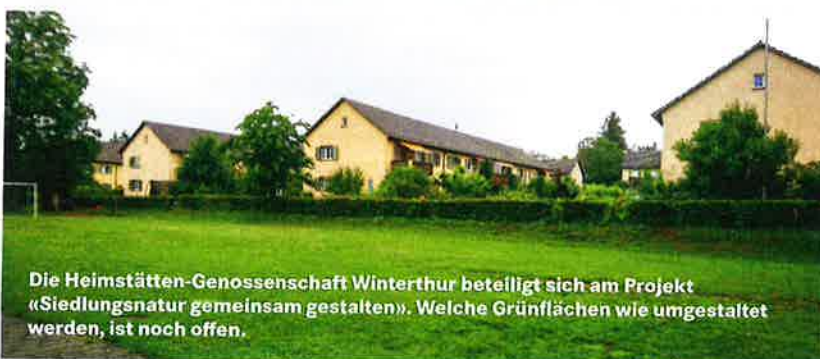
Die Heimstätten-Genossenschaft Winterthur beteiligt sich am Projekt «Siedlungsnatur gemeinsam gestalten». Welche Grünflächen wie umgestaltet werden, ist noch offen.

Auch das pragmatische und schrittweise Vorgehen hilft laut der GWG-Präsidentin, Verständnis und Akzeptanz zu schaffen. «Wir haben einige grundsätzliche Entscheide gefällt, setzen diese aber standortgerecht und flexibel um. Dort, wo Kinder spielen oder sich die Bewohnenden aufhalten, bleiben die Rasenflächen bestehen. Und sollten sich am einen oder anderen Ort mit der Zeit Nutzungsänderungen ergeben, kann man auch nachträglich noch beispielsweise neue Wege durch die Wiesen schaffen.» Um flexibel reagieren zu können, hat die GWG fürs Erste auf weitergehende Eingriffe wie das Anlegen neuer Hecken mit einheimischen Sträuchern verzichtet, die, einmal gepflanzt, nicht mehr versetzt werden können. Auch in anderen Punkten soll sich das Projekt organisch weiterentwickeln. So sind etwa noch nicht alle künftigen logistischen Abläufe festgelegt. Während die 30 Hauswartinnen und Hauswarte der GWG bislang mit herkömmlichen Geräten alle zwei Wochen den Rasen mähen, wird diese Frequenz nun gesenkt, und spätestens ab dem dritten Jahr dürfen die Blumenwiesen nur noch mit Balkenmähern oder Sen-