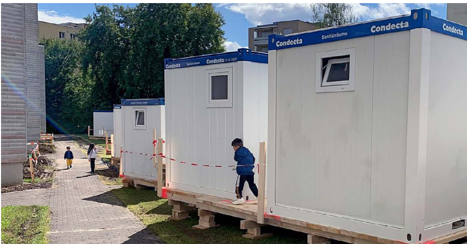
Perfekter Ort zum «Versteckis» spielen – zwischen den Wohncontainern

Die HGW saniert, wenn möglich, im bewohnten Zustand, damit Menschen ihr Zuhause behalten können. Damit solche Sanierungsphasen gelingen, braucht es gegenseitiges Verständnis und Flexibilität.