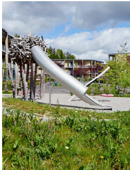
Raum für Bewegung und Spiel

Mehr dazu online auf unserer Webseite: hgw-wohnen.ch/miteinander